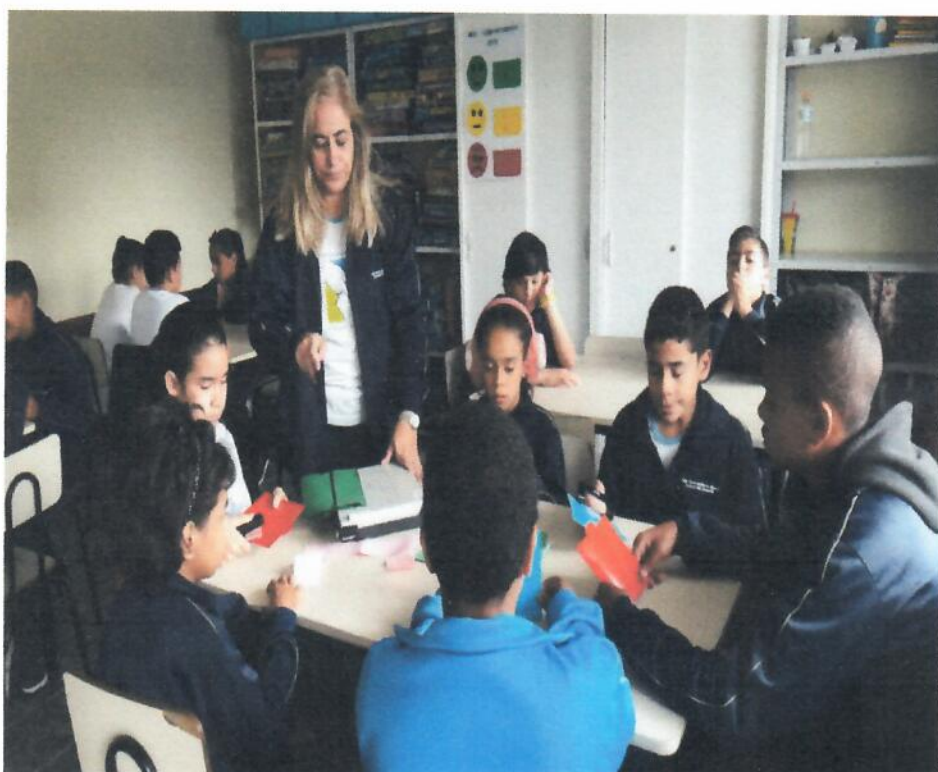
Uso da Guilhotina nas atividades