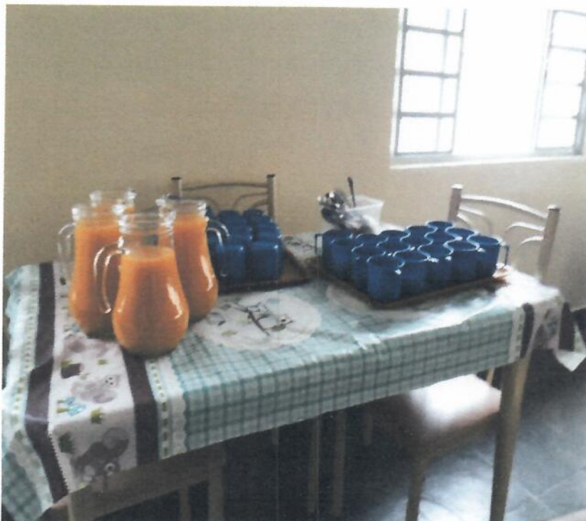
Uso das Jarras