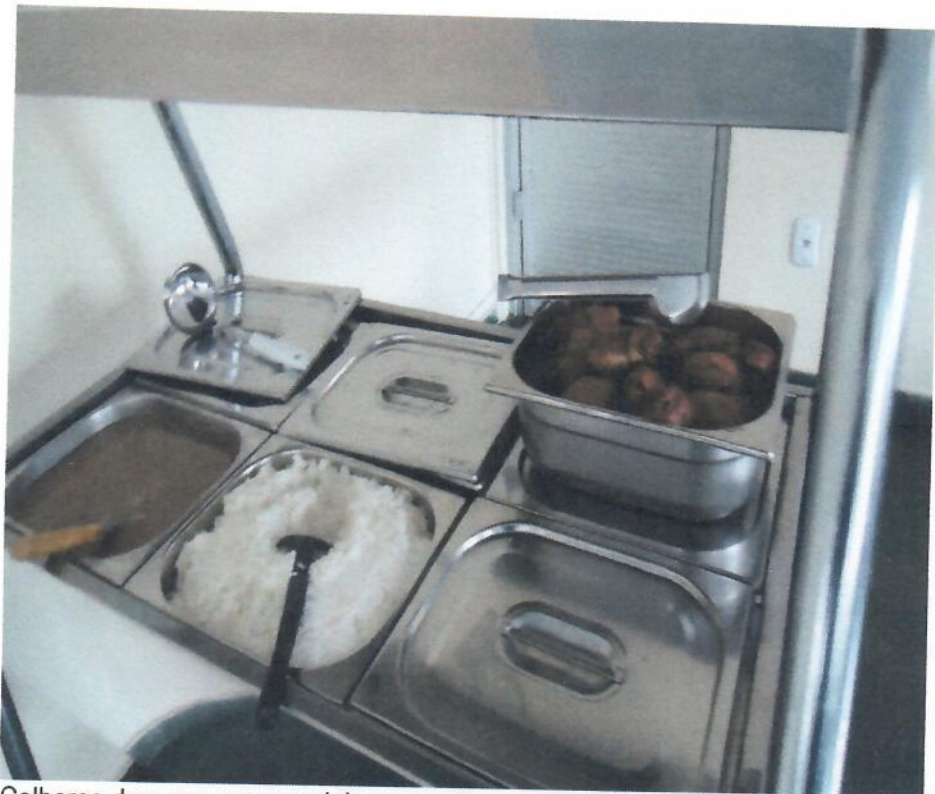
Colheres de arroz, espumadeira e concha