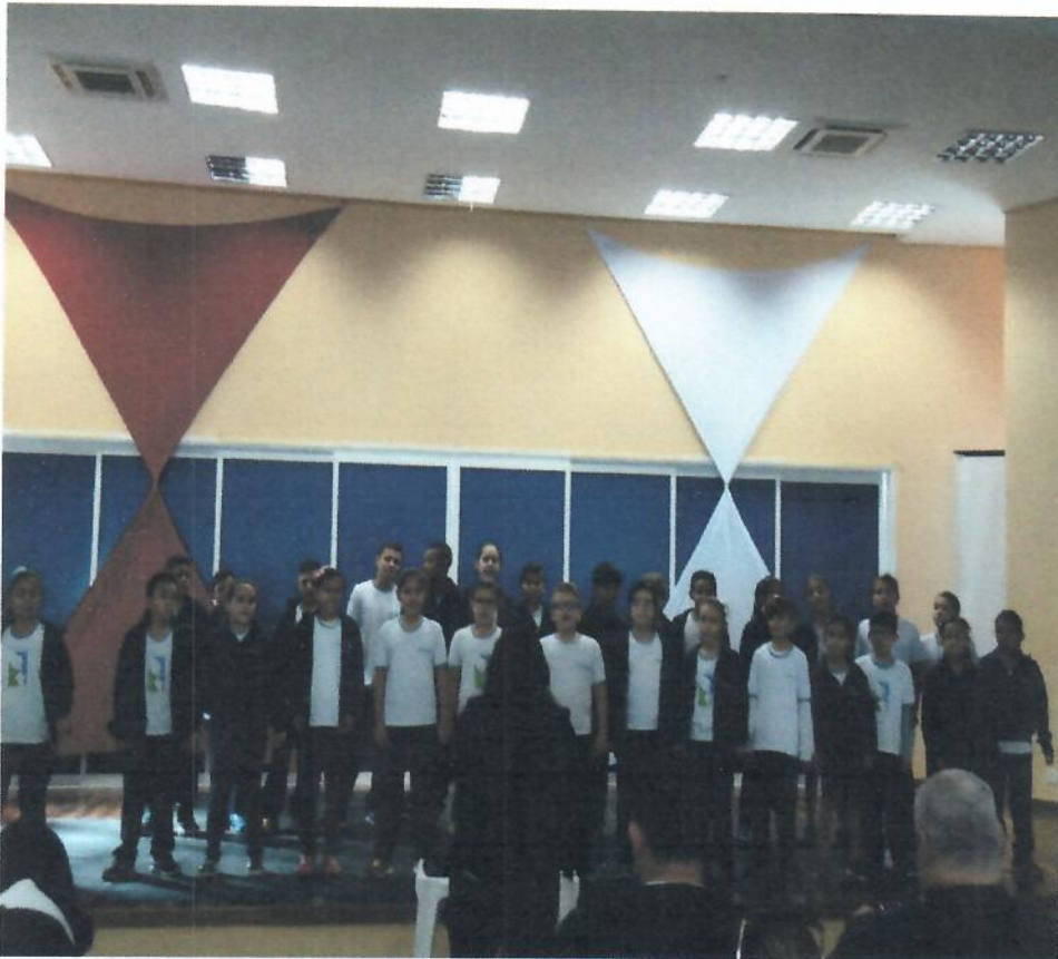
Uso do Uniformes