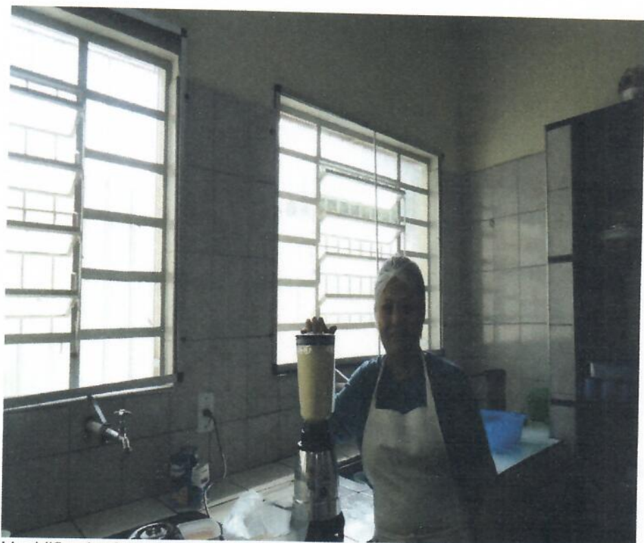
Liquidificador fornecendo vitamina