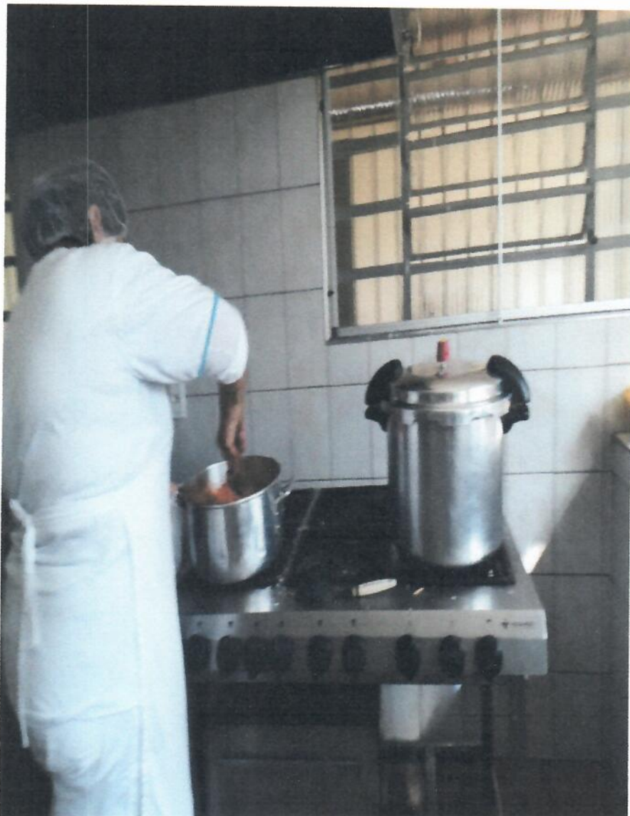
Panela de pressão