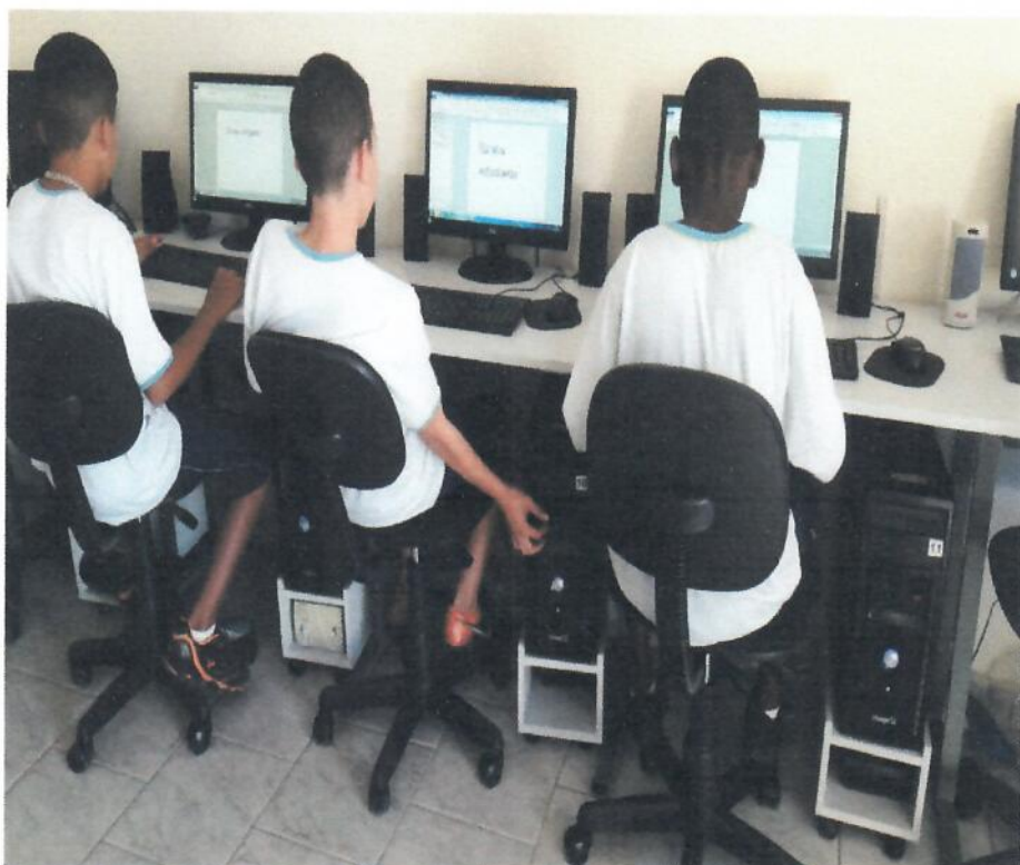
Uso do pen drive na Oficina de Inclusão Digital