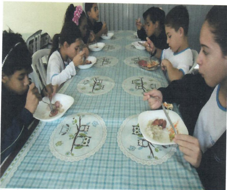
Uso dos pratos nas refeições