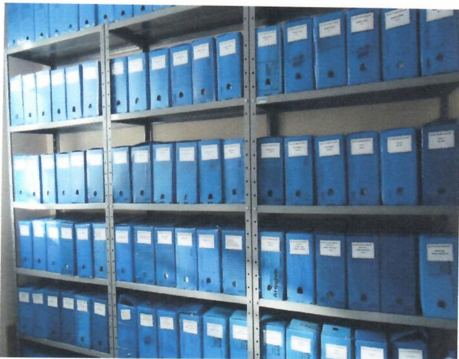
Caixas para arquivo