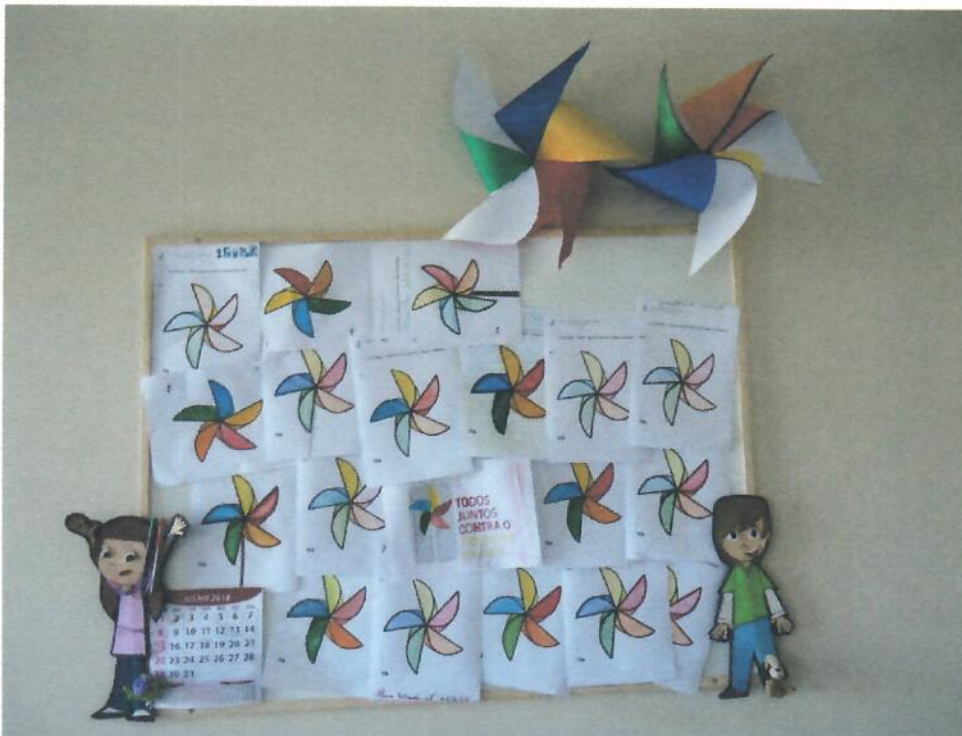
Quadro branco: Exposição Tema no quadro branco sobre a Erradicação Trabalho Infantil